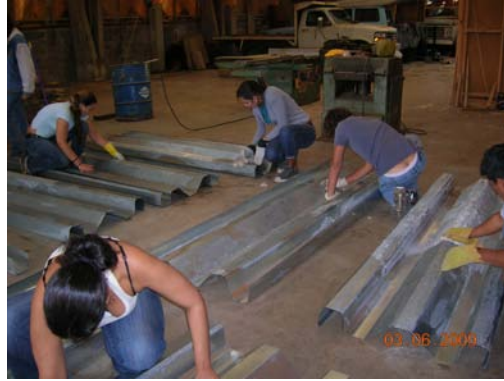
Foto 7. Preparación de material para re- utilizarlo