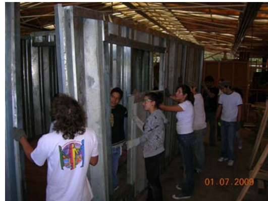
Fotos 14 y 15. Montaje de paredes portantes Sipromat