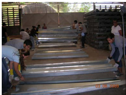
Foto 6. Presentación de material