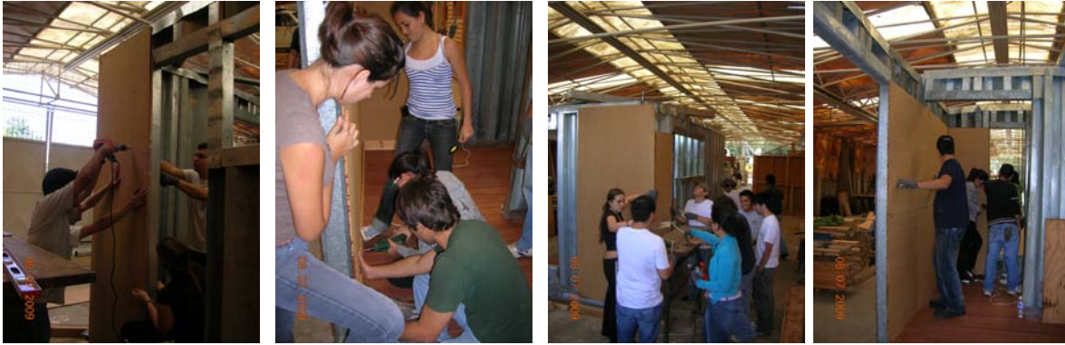
Fotos 18, 19, 20 y 21. Aplicación de revestimientos secos al prototipo Sipromat