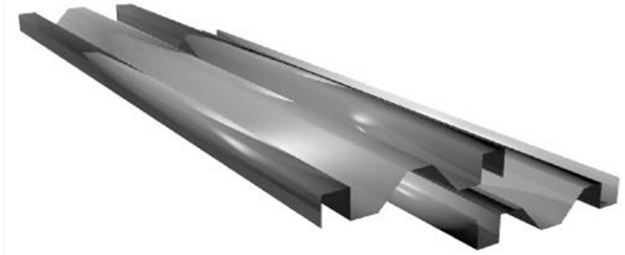
Figura 1. Componente básico Sipromat.

El componente básico cumple las funciones de elemento autoportante-estructural tanto en la posición vertical (muro portante), como en la posición horizontal utilizado como entrepiso ó en la posición inclinada como, cerramiento-cubierta. (Figura 1)