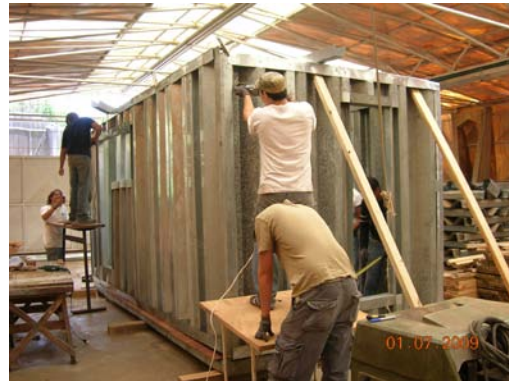
Fotos 22, 23, 24 y 25. Organización en cuadrillas de estudiantes para las diversas labores de producción del prototipo modular con tecnología Sipomat