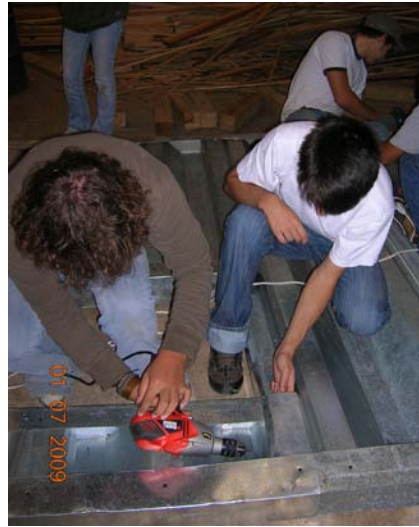
Fotos 16 y 17. Fijaciones de paneles portantes Sipomat