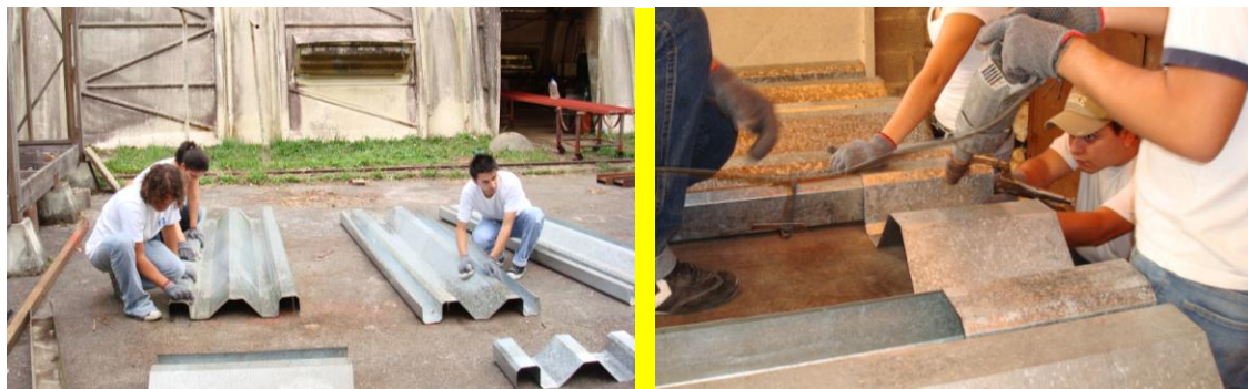
Estudiantes en tareas de de-construcción de módulos Sipromat y colocando fijaciones

Estos paneles de dimensiones de ancho total 700 mm y ancho útil 600 mm y longitudes variables, se van ensamblando a manera de lego solapando sus extremos, para ir obteniendo planos portantes y cajas resistentes, que al irse consolidando van incrementando su capacidad portante y por tanto su resistencia estructural. (González, 1999).