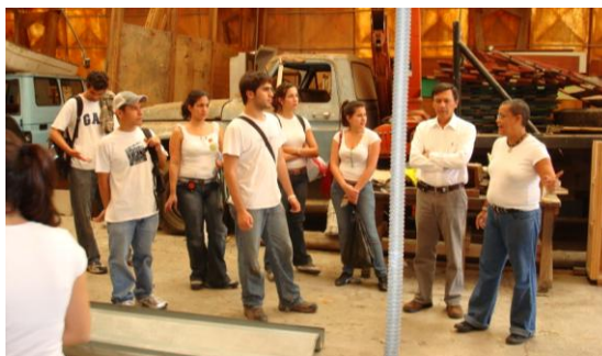
Izando un plano portante Sipromat y en una explicación en planta