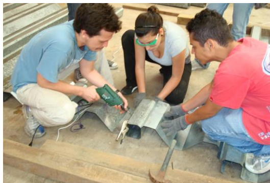
Estudiantes aprendiendo el manejo de herramientas de construcción armando planos portantes